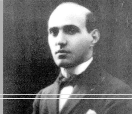
el mestre català l'any 1920