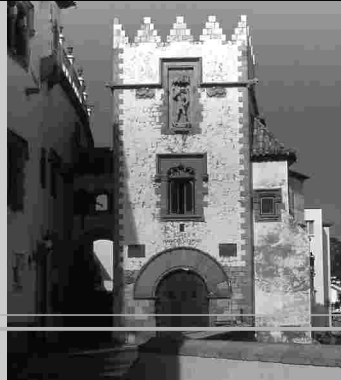
dues imatges de la vila vella de sitges